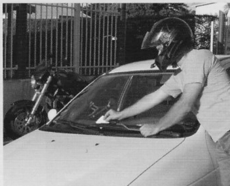
Rendez-vous était donné dès 14 heures ce samedi 26 février, près du monument américain (parking de la Moselle). L'initiateur de cette action : le Ducati Club de Nouvelle-Calédonie. L'objet de cette manifestation : sensibiliser Monsieur Tout le Monde sur les handicaps des handicapés... Cela paraît une lapalissade : et pourtant, c'est loin d'être gagné d'avance... Ici un membre du Ducati Club en pleine action...