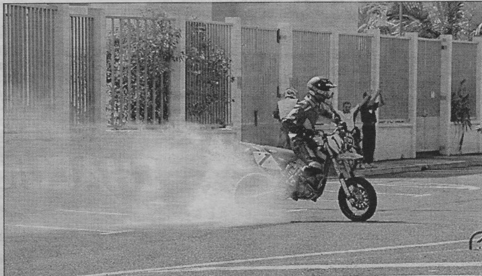
Les démonstrations de « run » effectuées par les super-motards ont été très applaudies.

L'esprit motard, c'est un ensemble... Chacun cherche à personnaliser sa machine en y ajoutant accessoires et gadgets. Sans parler du look indispensable !