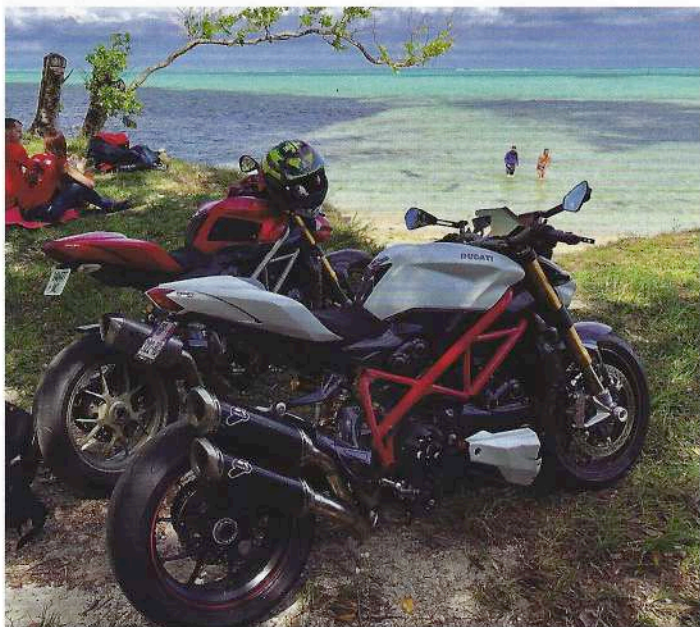
Le tour de la Grande Terre à moto, une boucle de plus de 1 000 km qui rassemble généralement 35 membres durant 3 jours.

C'est notamment ce qui donne envie d'adhérer à ce club. Ça nous unit vraiment, on apprend alors à mieux se connaître », précise Véronique en souriant. Elle est membre du club depuis plus de 10 ans et essaie de participer, dès qu'elle est disponible, au tour de la Grande Terre à moto. Cette boucle de plus de 1 000 kilomètres rassemble, chaque année, une trentaine de membres pour une petite trentaine de motos. Durant trois jours, les motards sillonnent les routes de la Nouvelle-Calédonie, de long en large. À l'heure où nous mettons sous presse, nous ne savons pas si la 20 e édition de ce tour sera maintenue du 30 octobre au 1 er novembre en raison de la crise sanitaire. Quand bien même il serait annulé, il sera reporté. Un tour « particulièrement long cette année pour marquer l'anniversaire, décrit le trésorier du club, puisque nous comptons passer par les transversales, dormir à Poum et à Poé. Le club essaie de proposer des sorties accessibles au plus grand nombre. Ils payent déjà les frais d'essence et d'entretien de la moto, donc on choisit la simplicité pour les hébergements ». Et d'ajouter : « Quand la transversale Hienghène Kaala-Gomen sera revêtue, on fera le tour de Calédonie en passant par là. C'est un super coin mais nous ne pouvons pas y aller tant que la route est dans cet état. » Les motos du Ducati Club vont partout, « tant que la route est revêtue ».