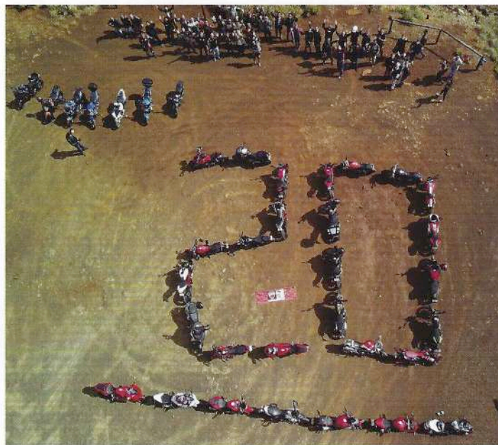
Le Ducati Club a déjà participé à la promotion de la sécurité routière auprès des plus jeunes, à la sensibilisation des usagers au respect des places handicapées, et assiste régulièrement aux rassemblements de motards.

C'est notamment ce qui donne envie d'adhérer à ce club. Ça nous unit vraiment, on apprend alors à mieux se connaître », précise Véronique en souriant. Elle est membre du club depuis plus de 10 ans et essaie de participer, dès qu'elle est disponible, au tour de la Grande Terre à moto. Cette boucle de plus de 1 000 kilomètres rassemble, chaque année, une trentaine de membres pour une petite trentaine de motos. Durant trois jours, les motards sillonnent les routes de la Nouvelle-Calédonie, de long en large. À l'heure où nous mettons sous presse, nous ne savons pas si la 20 e édition de ce tour sera maintenue du 30 octobre au 1 er novembre en raison de la crise sanitaire. Quand bien même il serait annulé, il sera reporté. Un tour « particulièrement long cette année pour marquer l'anniversaire, décrit le trésorier du club, puisque nous comptons passer par les transversales, dormir à Poum et à Poé. Le club essaie de proposer des sorties accessibles au plus grand nombre. Ils payent déjà les frais d'essence et d'entretien de la moto, donc on choisit la simplicité pour les hébergements ». Et d'ajouter : « Quand la transversale Hienghène Kaala-Gomen sera revêtue, on fera le tour de Calédonie en passant par là. C'est un super coin mais nous ne pouvons pas y aller tant que la route est dans cet état. » Les motos du Ducati Club vont partout, « tant que la route est revêtue ».